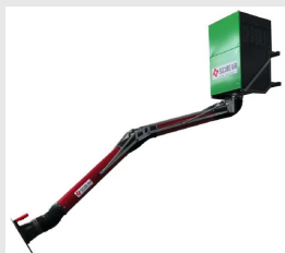
Aspiratore fumi saldatura da parete WFU con braccio rigido WFU18BR00000000

Aspiratore mobile per fumi e micro-polveri di saldatura MFU-HW con braccio red, ad alte prestazioni per uso professionale, con filtrazione assoluta HEPA H13 99,99%