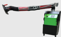
Aspiratore fumi MFUHCO MFU21HCO0000000

Aspiratore fumi di saldatura da parete WFU18 filtrazione efficienza H13 99,99%.