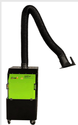
Aspiratore fumi di saldatura MFU-HW con braccio superflex MFU21HWXF000000

Aspiratore fumi di saldatura mobile ad alte prestazioni per uso professionale, con filtrazione assoluta HEPA H13 99,99%