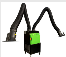
Aspiratore fumi saldatura MFU-HWF23 doppio braccio da 3mt MFU21HW32F00000

Aspiratore fumi di saldatura mobile ad alte prestazioni per uso professionale, con filtrazione assoluta HEPA H13 99,99%